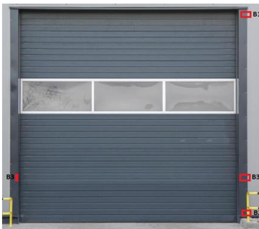
Rysunek 1. Brama przemysłowa z rozmieszczeniem czujników